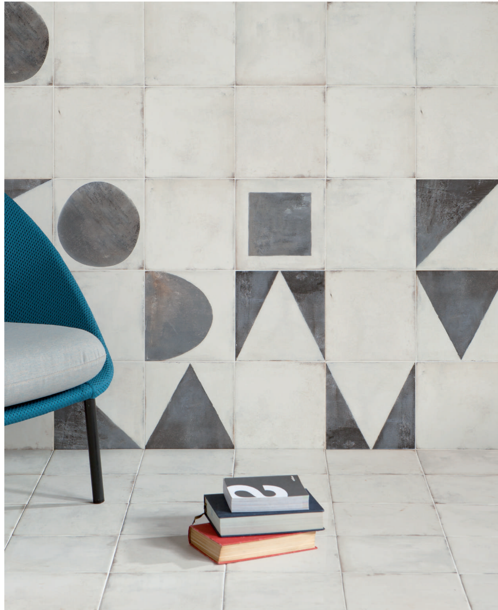
MAISON PLAIN MAISON DECOR