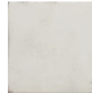
20204 MAISON PLAIN Q-6 (22,3X22,3)