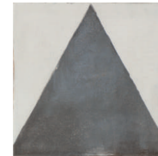
* 20205 MAISON DECOR Q-6 (22,3X22,3)